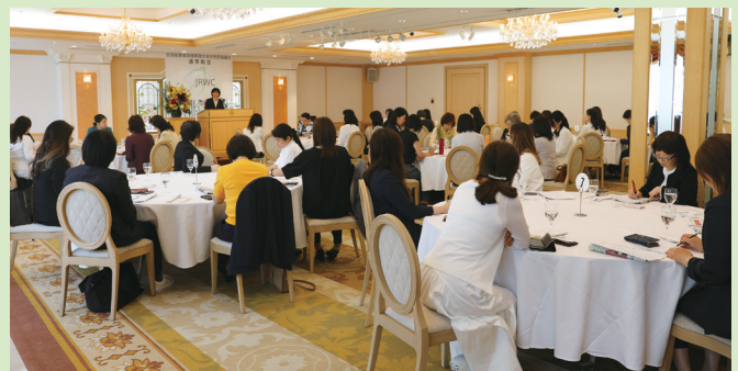
第2回 通常総会時の集合写真(上)と講演会の様子(下) 2024.6.14